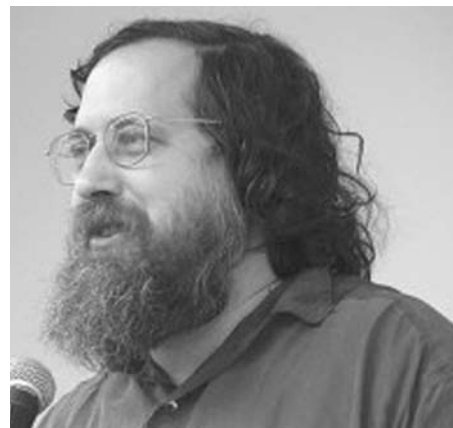
RICHARD M. STALLMAN

ambienti scientifici, quest'ultimo principio è tenuto in alta considerazione per la fecondità che ha dimostrato; ad esso infatti è generalmente attribuita molta parte dell'eccezionale ed imprevedibile crescita del sapere negli ultimi tre secoli. La libertà di scambio di idee non è tuttavia una questione puramente pratica: essa è anche alla base dei concetti di libertà di pensiero e di espressione. Analogamente alle idee, il software è immateriale, e può essere riprodotto e trasmesso facilmente. Come avviene per le idee, parte essenziale del processo di evoluzione del software è la sua libera diffusione. Ed ogni giorno di più anche il software permea il tessuto sociale e lo influenza, produce effetti etici, economici, politici e culturali.