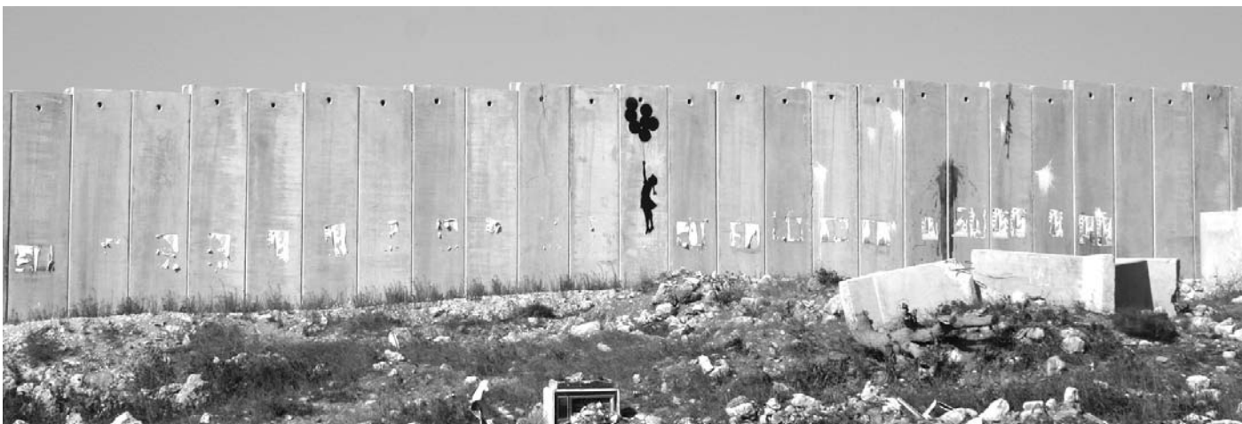
GERUSALEMME EST . IL MURO DELLA VERGOGNA

L'uomo nella sua millenaria storia ha sempre cercato di difendersi