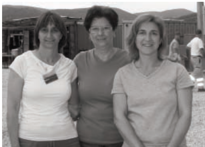
Alcune mamme del campo

Fin dai tempi più antichi il ruolo della mamma è sempre stato al centro del nucleo familiare anche se negli ultimi anni sono stati portati dei forti cambiamenti a questo lavoro millenario. Uno dei primi cambiamenti è stato la "mamma part-time" o meglio chiamata "baby sitter", che si va lentamente ad integrare nel mondo dei bambini. È stata una conseguenza del fatto che le donne sono occupate, almeno per mezza giornata a lavoro, e quindi non hanno il tempo di restare a casa a fare i