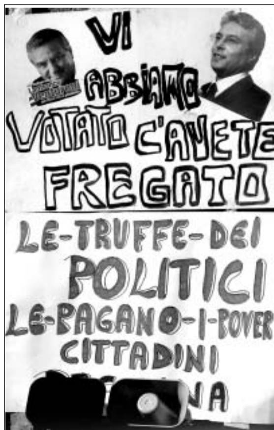
PESCARA 12 NOVEMBRE 2009