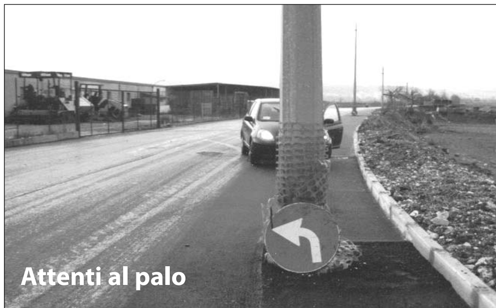
Attenti al palo

VIA DELL'ABBADIA - Nel transitare nella realizzanda via dell'Abbadia ci siamo imbattuti in alcuni manufatti che, ci pare, insistano all'interno della carreggiata rotabile, ovvero in dei nuovi pali della corrente e nelle vecchie bocchette dell'irrigazione. Rimarranno così?