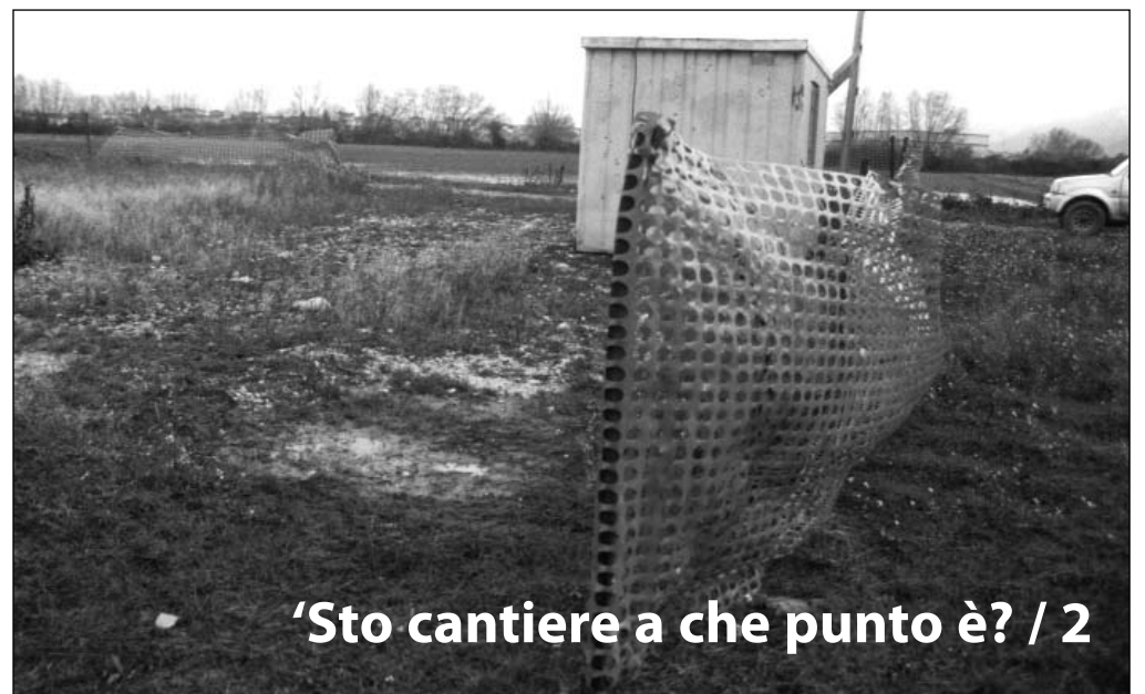
'Sto cantiere a che punto è? / 2

VIA DELL'ABBADIA - Nel transitare nella realizzanda via dell'Abbadia ci siamo imbattuti in alcuni manufatti che, ci pare, insistano all'interno della carreggiata rotabile, ovvero in dei nuovi pali della corrente e nelle vecchie bocchette dell'irrigazione. Rimarranno così?